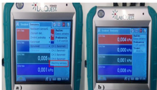
Obr. 3 Vynulování dataloggeru Vernier

Nejprve vynulujeme všechna tlaková čidla (obr. 3a). V položce Senzory zvolíme Vynulovat a dále Všechny senzory (červený rámeček na obr. 3). Pokud jsou čidla v pořádku, měli bychom získat výsledek podobný zobrazenému na obr. 3b.