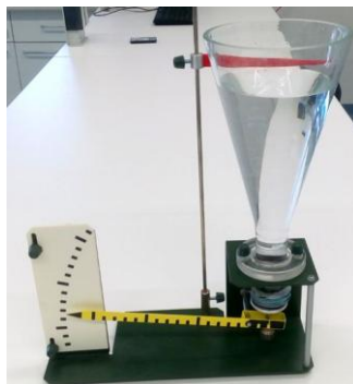
Obr. 1 Hartlův přístroj k ověření hydrostatického paradoxu

jeme kapalinu do námi zvolené výšky stejné ve všech nádobách a permanentním fixem vyznačíme na všech lahvích rysky. Kvůli rychlým výpočtům po provedení měření je vhodné volit výšku vody např. 15 cm, 20 cm.