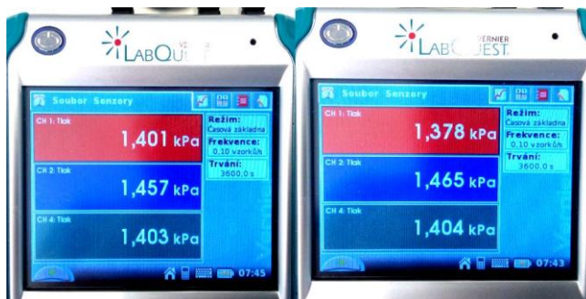
Obr. 5 Ukázka naměřených hodnot

Naměřené hodnoty zobrazíme žákům na projektoru pomocí dokumentové kamery nebo vyzveme nějakého žáka k zápisu hodnot na tabuli. Ukázka různých naměřených hodnot pro výšku vodního sloupce 15 \text{ cm} je na následujícím obr. 5.