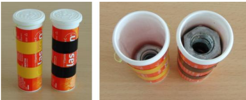
Obr. 2 Použitá tělesa

Ponoříme-li těleso do kapaliny, je nadlehčováno vztlakovou silou, jejíž velikost je dána tzv. Archimédovým zákonem. Cílem experimentu je ukázat, že velikost vztlakové síly opravdu nezávisí na hmotnosti ponořeného objektu, ale pouze na objemu ponořené části.